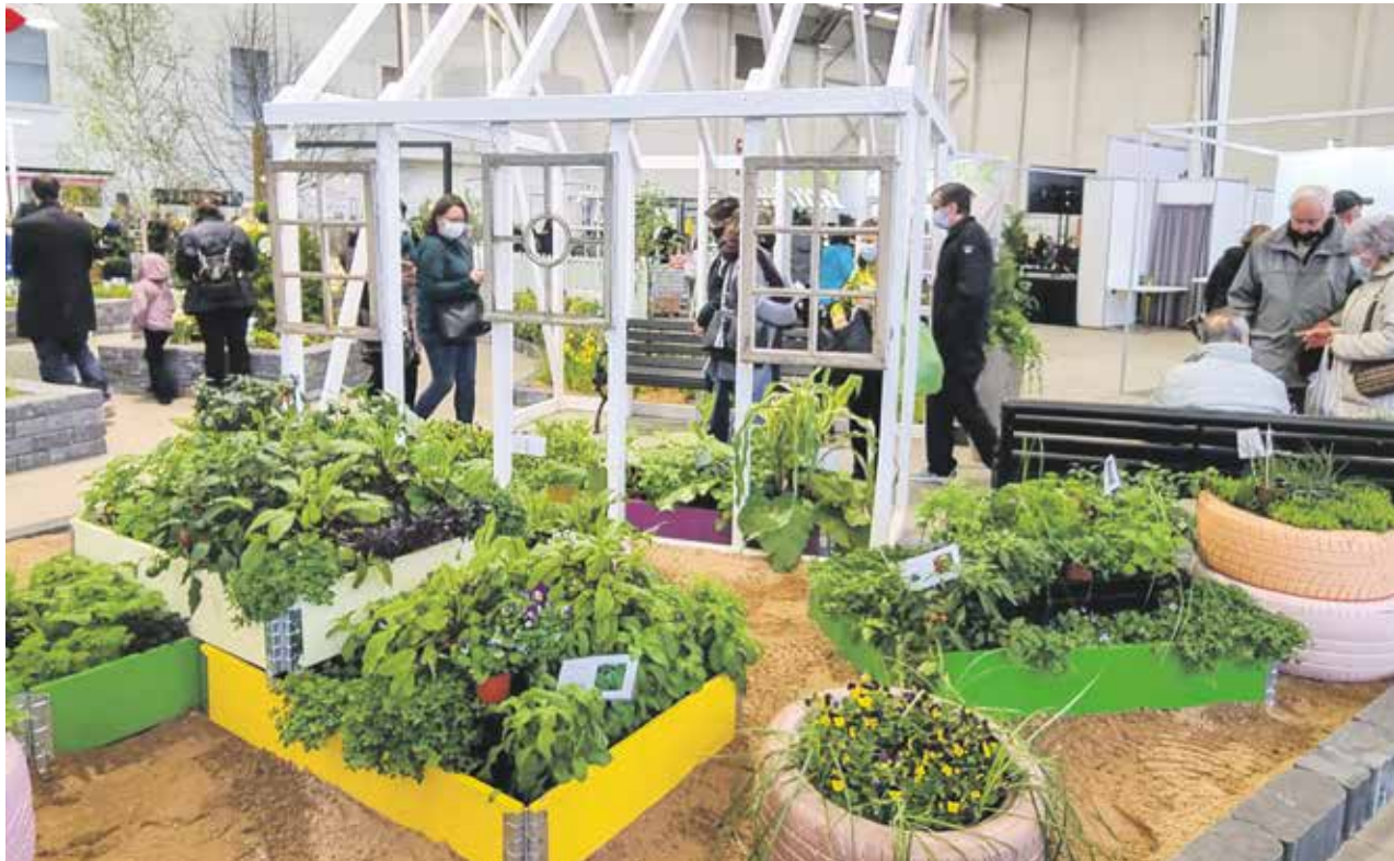
Kevätpuutarha innostaa kävijöitä valmistautumaan puutarhakevääseen kirkossa 22.4.2023 klo 18.30.