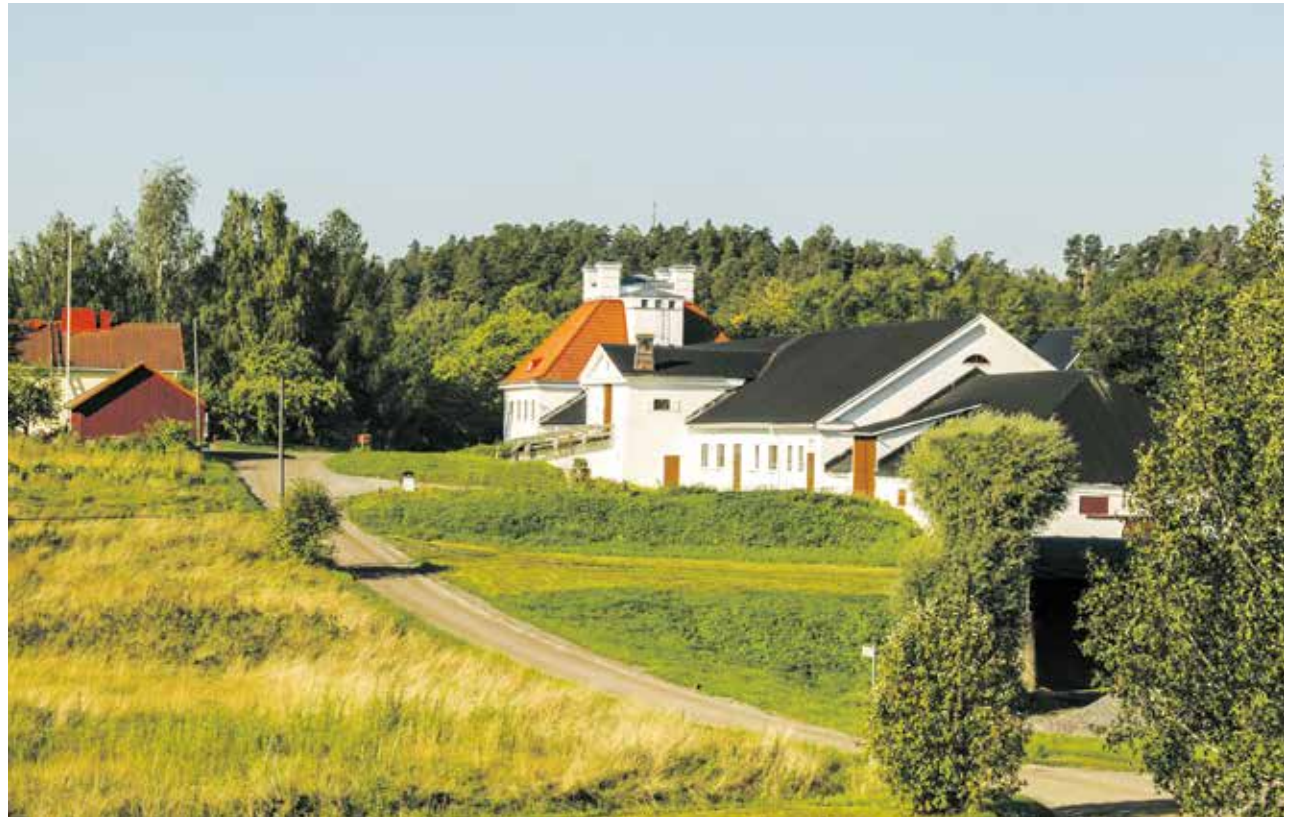
Desicon kynttilätehtaan rakennus, Isidorintien navetta, on mahdollisesti arkkitehti Lars Sonckin suunnittelema.

– Arvomme ovat erityisesti raaka-ainehankinnossa, pyrimme käyttämään