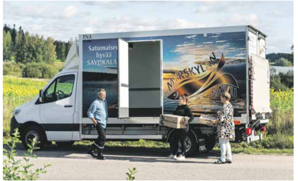
Myrskylän Savukala palvelee ammattitaidolla.

– Tuotteita myydään meidän omassa tehta-