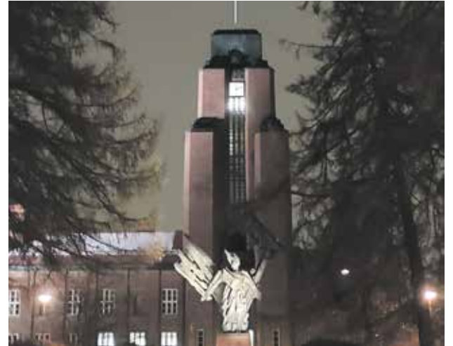
Kaupungintalon tornissa on neljä kelloa eri ilmansuuntiin.