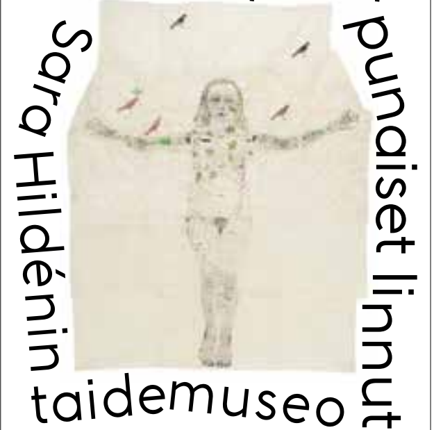
Kiki Smith, Red Birds on Green Tree, 2006. Sara Hildénin Säätiö