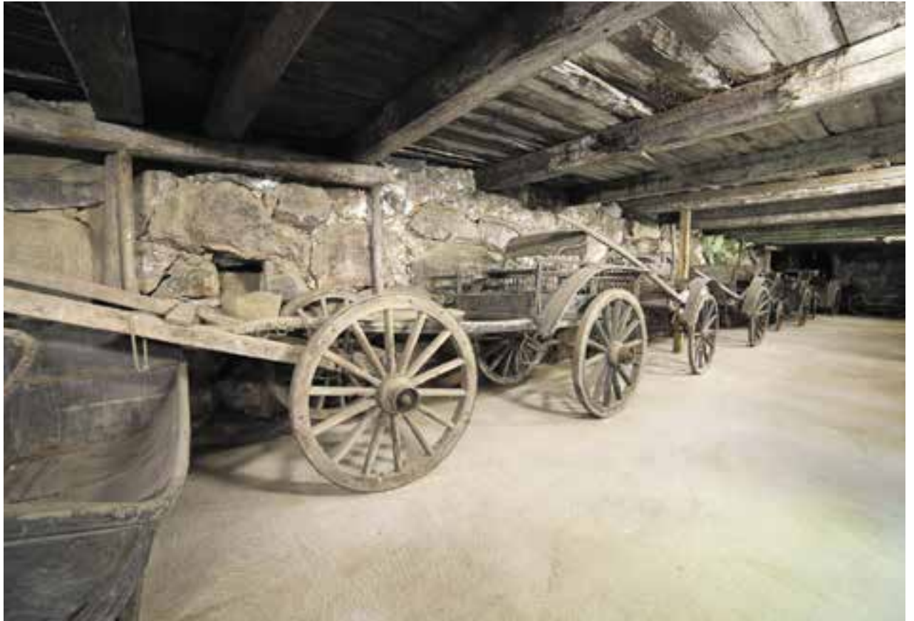
Asikkalan kotiseutumuseon hevosvetoisia kulkuvälineitä ajokalamuseossa.